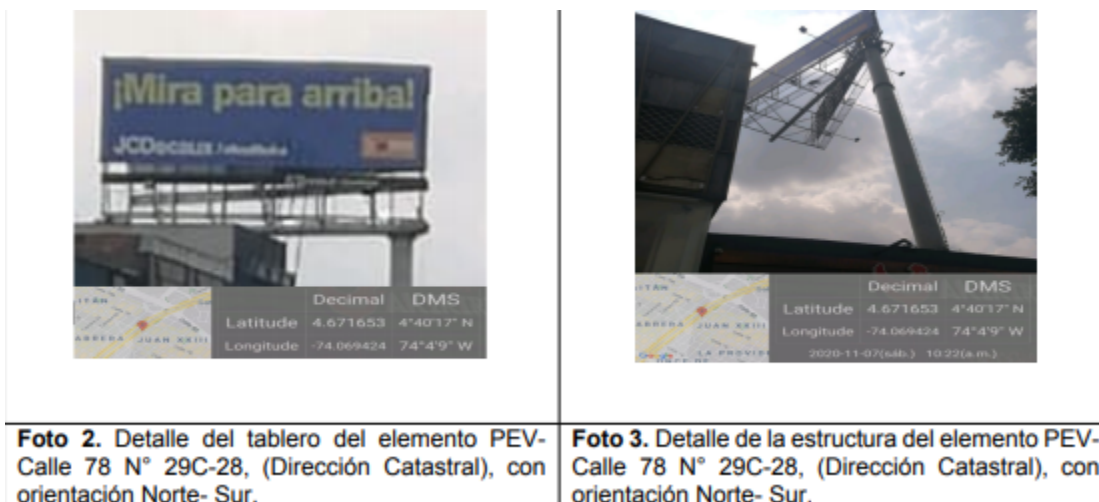
Foto 2. Detalle del tablero del elemento PEV- Calle 78 N° 29C-28, (Dirección Catastral), con orientación Norte- Sur.